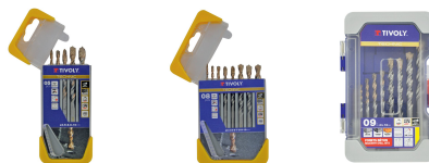
5 forets béton gradués SLR Ø 4 à 10mm