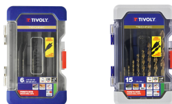
6 brocas planas para madera Ø 14 a 24 mm 15 piezas -9 brocas de madera HSS speed point Ø 2 a 10 mm + 6 brocas de madera planas Ø 14 a 24 mm