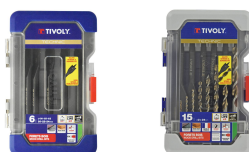
6 brocas planas para madera Ø 14 a 24 mm