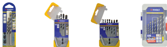
3 brocas para hormigón graduadas SLR Ø 5 a 8 mm 5 brocas para hormigón graduadas SLR Ø 4 a 10 mm 8 brocas para hormigón graduadas SLR Ø 3 a 10 mm 9 brocas para hormigón graduadas SLR Ø 3 a 12 mm