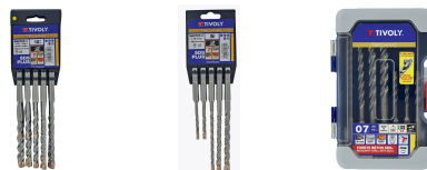
10 brocas MASTER3 SDS+ 3 filos L. 110-160 mm Ø 6 a 14 mm 5 brocas MASTER3 SDS+ 3 filos L. 110-160 mm Ø 5 a 10 mm 7 brocas MASTER3 SDS+ 3 filos L. 110-160 mm Ø 5 a 12 mm