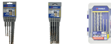
5 brocas SPEEDER2 SDS+ 2 filos L. 110-160 mm Ø 5 a 10 mm