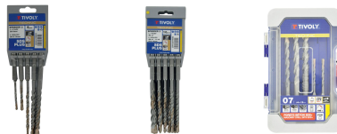
5 brocas SPEEDER2 SDS+ 2 filos L. 110-160 mm Ø 5 a 10 mm