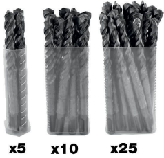
x5 x10 x25

Broca de alto rendimiento para el taladrado superrápido y precios de hormigones vibrados y piedras, gracias a su cuádruple ranura y su placa con punta de centrado.