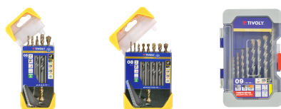
5 brocas para hormigón graduadas SLR Ø 4 a 10 mm 8 brocas para hormigón graduadas SLR Ø 3 a 10 mm 9 brocas para hormigón graduadas SLR Ø 3 a 12 mm