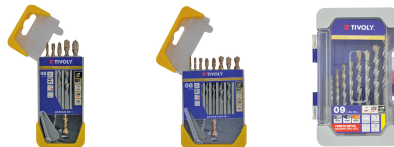
5 brocas para hormigón graduadas SLR Ø 4 a 10 mm 8 brocas para hormigón graduadas SLR Ø 3 a 10 mm 9 brocas para hormigón graduadas SLR Ø 3 a 12 mm