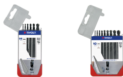
6 brocas para metal HSS STEAM rectificadas punta en cruz Ø 2 a 8 mm