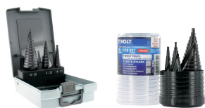
3 brocas escalonadas HSS-E5 (Cobalto 5 %) con recubrimiento TiAIN Ø 4 a 30 mm