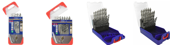
6 brocas para metal HSS Afilado Tivoly Smart Point Ø 1 a 8mm