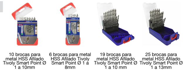
10 brocas para metal HSS Afilado Tivoly Smart Point Ø 1 a 10mm