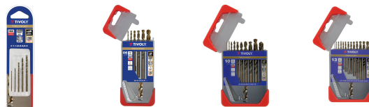
5 brocas para metal HSS-E5 (cobalto 5 %) graduadas SLR punta en cruz Ø 1 a 3 mm 6 brocas para metal HSS-E5 (cobalto 5 %) graduadas SLR punta en cruz Ø 1 a 8 mm 10 brocas para metal HSS-E5 (cobalto 5 %) graduadas SLR Ø 1 a 10 mm 13 brocas para metal HSS-E5 (cobalto 5 %) graduadas SLR punta en cruz Ø 1,5 a 6,5 mm