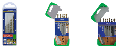
5 forets bois speed point Ø 2 à 5mm 6 forets bois speed point Ø 2 à 8mm 8 forets bois speed point Ø 2 à 10mm