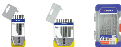
5 forets béton Ø 4 à 10mm 8 forets béton Ø 3 à 10mm 9 forets béton Ø 3 à 12mm