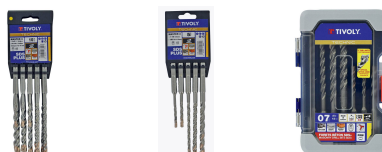
10 forets MASTER3 SDS+ 3 Taillants L 110- 160mm Ø 6 à 14mm 5 forets MASTER3 SDS+ 3 taillants L 110- 160mm Ø 5 à 10mm 7 forets MASTER3 SDS+ 3 Taillants L 110- 160mm Ø 5 à 12mm