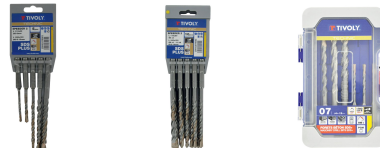
5 forets SPEEDER2 SDS+ 2 taillants L 110- 160mm Ø 5 à 10mm 10 forets SPEEDER2 SDS+ 2 taillants L 110- 160mm Ø 6 à 14mm 7 forets SPEEDER2 SDS+ 2 taillants quadruple goujures pointe de centrage L 110- 160mm Ø 4 à 12mm