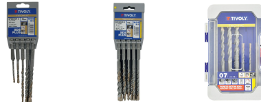
5 forets SPEEDER2 SDS+ 2 taillants L 110- 160mm Ø 5 à 10mm 10 forets SPEEDER2 SDS+ 2 taillants L 110- 160mm Ø 6 à 14mm 7 forets SPEEDER2 SDS+ 2 taillants quadruple goujures pointe de centrage L 110- 160mm Ø 4 à 12mm