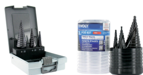
3 forets étagés HSS revêtus TiAIN Ø 4 à 30mm 3 forets étagés HSS revêtus TiAIN Ø 4 à 37mm