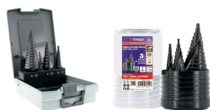
3 forets étagés HSS revêtus TiAlN Ø 4 à 30mm 3 forets étagés HSS revêtus TiAlN Ø 4 à 37mm