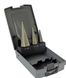
3 forets HSS coniques étagés goujures droites Ø 4 à 30mm