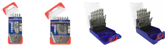
6 Forets métaux HSS taillé meulé affûtage Tivoly Smart Point Ø 1 à 8mm