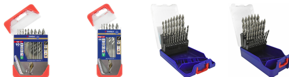
10 forets métaux HSS taillé meulé affûtage Tivoly Smart Point Ø 1 à 10mm