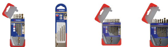
6 Forets métaux HSS-E5 (Cobalt 5%) gradués SLR pointe en croix Ø 1 à 8mm 5 forets métaux HSS-E5 (Cobalt 5%) gradués SLR pointe en croix Ø 1 à 3mm 13 forets métaux HSS-E5 (Cobalt 5%) gradués SLR pointe en croix Ø 1,5 à 6,5mm 10 forets métaux HSS-E5 (Cobalt 5%) gradués SLR Ø 1 à 10mm