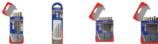
6 Forets métaux HSS-E5 (Cobalt 5%) gradués SLR pointe en croix Ø 1 à 8mm 5 forets métaux HSS-E5 (Cobalt 5%) gradués SLR pointe en croix Ø 1 à 3mm 13 forets métaux HSS-E5 (Cobalt 5%) gradués SLR pointe en croix Ø 1,5 à 6,5mm 10 forets métaux HSS-E5 (Cobalt 5%) gradués SLR Ø 1 à 10mm