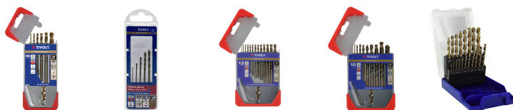
6 Forets métaux HSS-E5 (Cobalt 5%) gradués SLR pointe en croix Ø 1 à 8mm 5 forets métaux HSS-E5 (Cobalt 5%) gradués SLR pointe en croix Ø 1 à 3mm 13 forets métaux HSS-E5 (Cobalt 5%) gradués SLR pointe en croix Ø 1,5 à 6,5mm 10 forets métaux HSS-E5 (Cobalt 5%) gradués SLR Ø 1 à 10mm 19 forets métaux HSS-E5 (Cobalt 5%) gradués SLR pointe en croix Ø 1 à 10mm