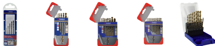
5 forets métaux HSS-E5 (Cobalt 5%) gradués SLR pointe en croix Ø 1 à 3mm 6 Forets métaux HSS-E5 (Cobalt 5%) gradués SLR pointe en croix Ø 1 à 8mm 10 forets métaux HSS-E5 (Cobalt 5%) gradués SLR Ø 1 à 10mm 13 forets métaux HSS-E5 (Cobalt 5%) gradués SLR pointe en croix Ø 1,5 à 6,5mm 19 forets métaux HSS-E5 (Cobalt 5%) gradués SLR pointe en croix Ø 1 à 10mm