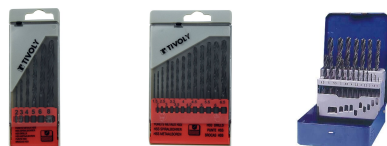
6 forets métaux HSS laminés Ø 2 à 8mm 13 forets métaux HSS laminés Ø 1,5 à 6,5mm 19 forets métaux HSS laminés Ø 1 à 10mm par 1/2