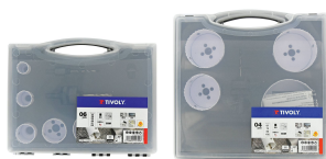
Mallette de 9 pièces - 6 scies cloches bi-métal HSS Ø 22 à 68mm + 2 arbres pilotes + 1 adaptateur Mallette de 5 pièces - 4 scies cloches bi-métal HSS Ø 67 à 102mm + 1 arbre pilote