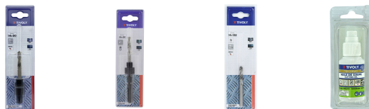
Arbre pilote bi-métal - Queue hexagonale ESSENTIAL (Blister) Arbre pilote bi-métal - Queue SDS+ ESSENTIAL (Blister) Forets Pilotes ESSENTIAL (Blister) Huile de coupe biodégradable 70% TECHNIC (Blister Box)